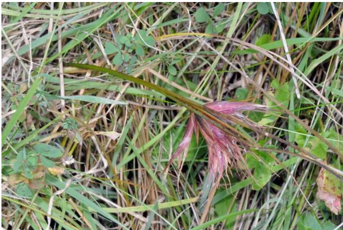
Gal van de russenbladvlo