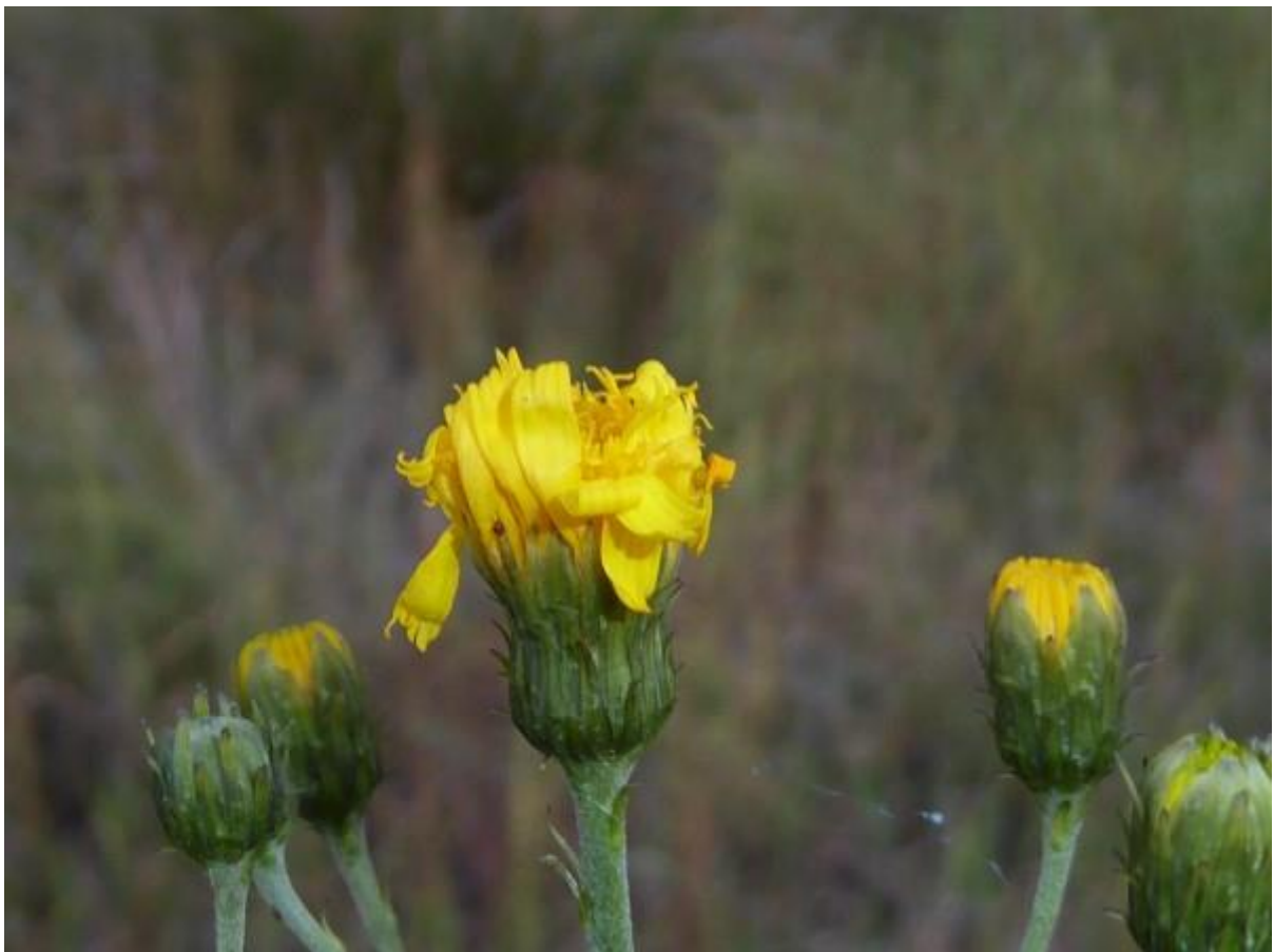
Ra ra ra wie ben ik?